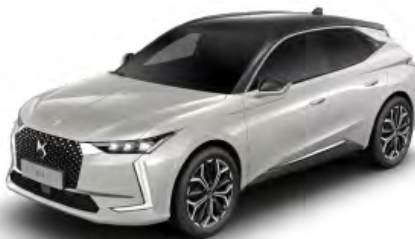
Biela Perleť (P)