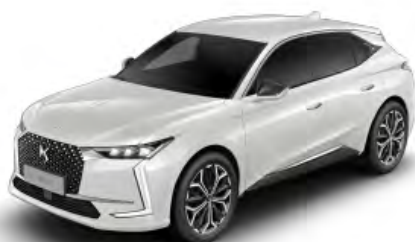
Biela Perleť (P)