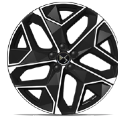
Zliatinové disky 19" LIMA (ZHT2) voliteľná výbava pre PALLAS