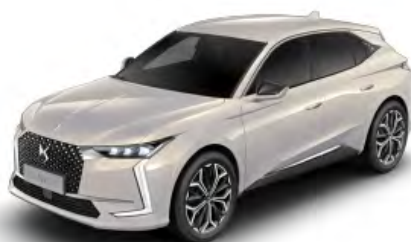
Sivá Cristal Pearl (M)