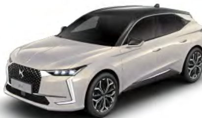
Sivá Cristal Pearl (M)