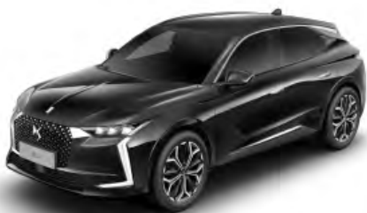
Čierna Perla Nera (M)