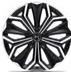
Zliatinové disky 19" SEVILLA (ZHT4) v sérii pre ÉTOILE ALCANTARA / NAPPA