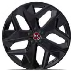
Zliatinové disky 19" MINNEAPOLIS (ZHT1) voliteľná výbava