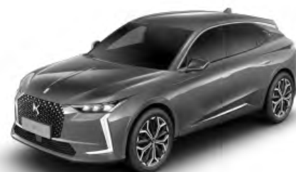
Sivá Platinium (M)