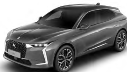
Sivá Platinium (M)