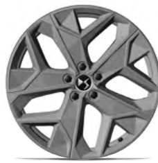
Zliatinové disky 19" SAPPORO (2HS9) v sérii pre PALLAS