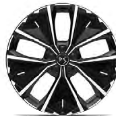
Zliatinové disky 20" SYDNEY (ZHT8) voliteľná výbava pre PLUG-IN HYBRID 225